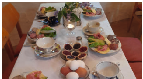
Muttertagsfrühstück in Plötzky