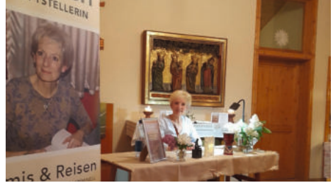
Buchlesung am 07.05.26 in Plötzky