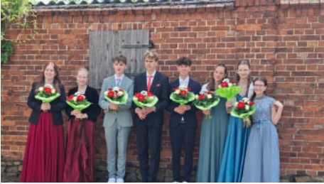
Konfirmation am 24.05.26 in Gommern