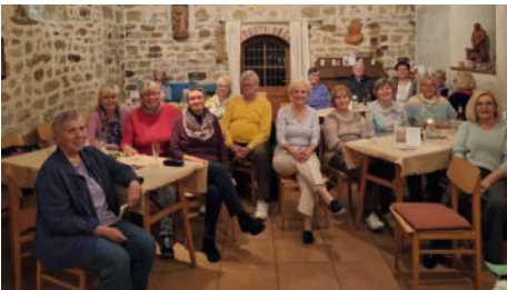
Buchlesung am 07.05.26 in Plötzky