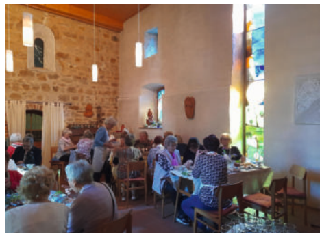
Muttertagsfrühstück in Plötzky