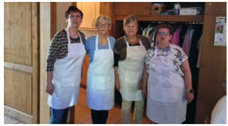
Muttertagsfrühstück in Plötzky