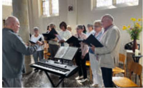
Ökumenischer Chor beim Sommerfest