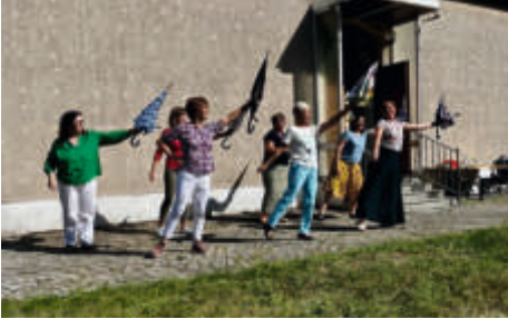
Sommerfest der Kirchen