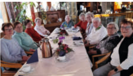
Besuch der Plötzkyer im Pflegeheim