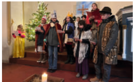
Krippenspiel in Karith