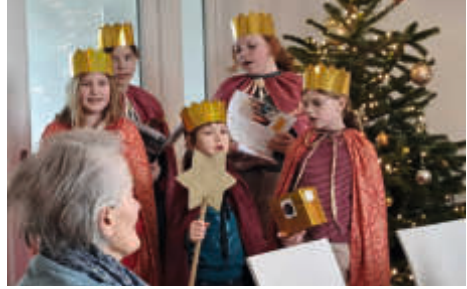
Sternsinger in Karith