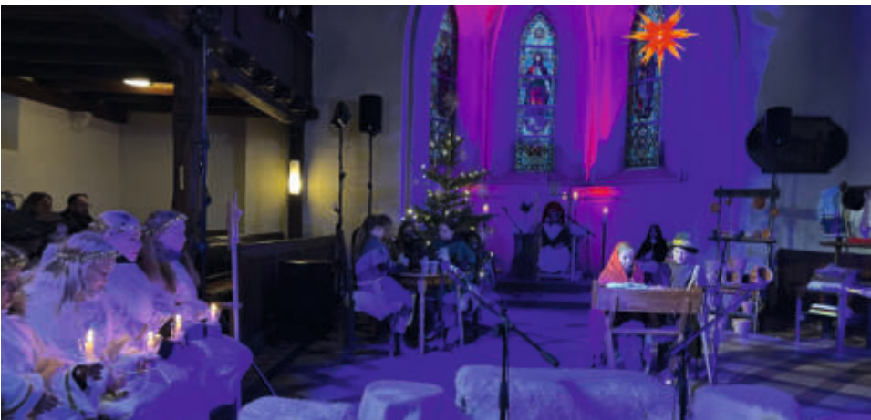
Krippenspiel in Gommern