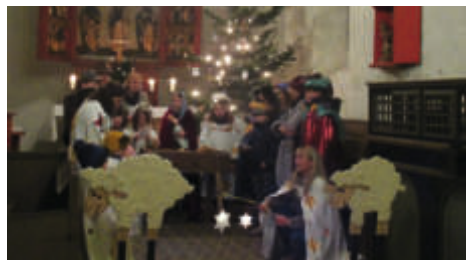
Krippenspiel in Vehlitz