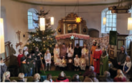
Christvesper mit Krippenspiel in Dannigkow