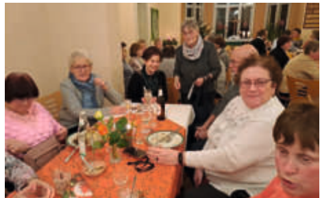
Ehrenamtsempfang in Gommern