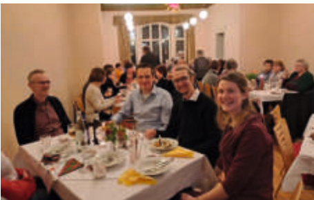
Ehrenamtsempfang in Gommern