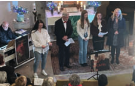
Benefizkonzert in Dannigkow